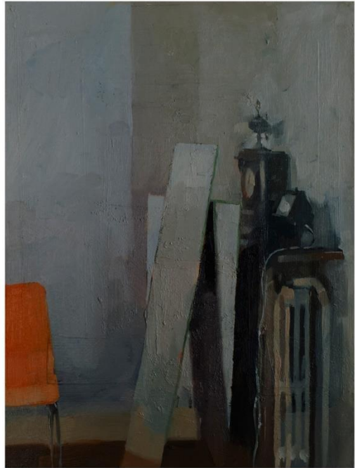
Room #22, 18cm x 24 cm 2016