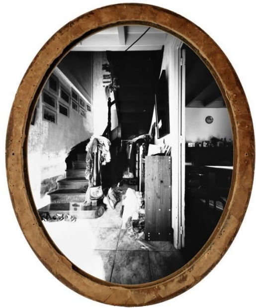
Miroir-Entrée, 46 cm x 56 cm 2016