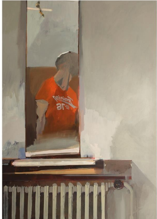
Reflected Presence #5, 100cm x 140 cm 2016