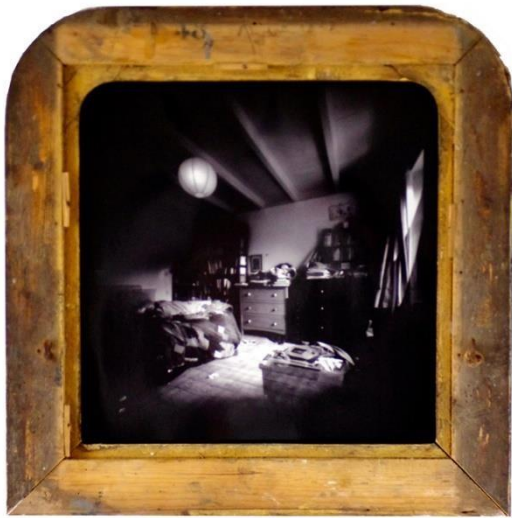
Miroir-Chambre, 48 cm x 48 cm 2015