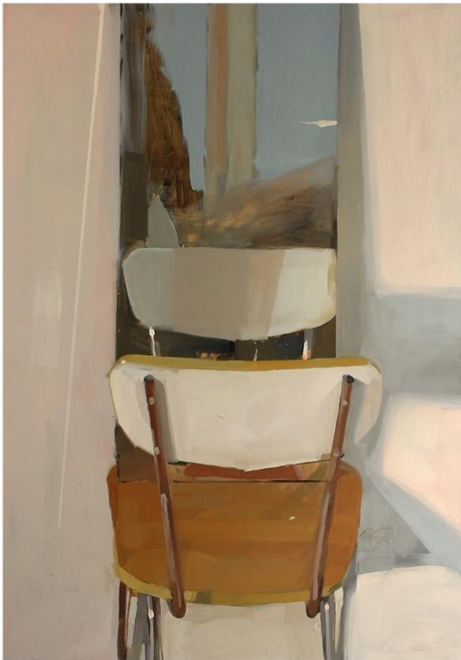
Reflected Presence #1, 70cm x 100 cm 2016