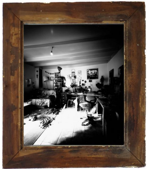
Miroir-Salon, 48 cm x 56 cm 2016