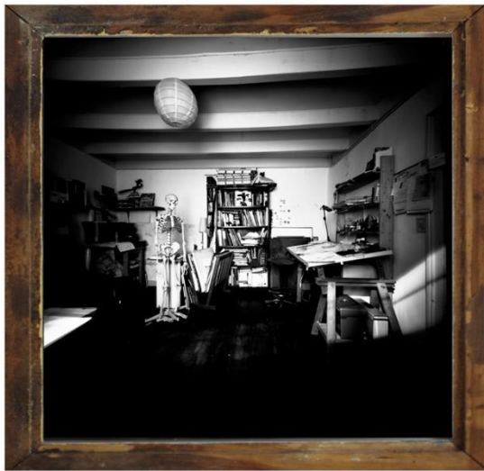
Miroir-Bureau, 50 cm x 50 cm 2016